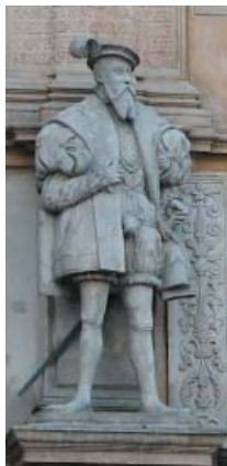
Obr. 1. Jiří II. Lehnicko-Břežský.