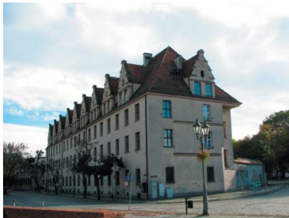
Obr. 2. Budova gymnázia v Břehu.